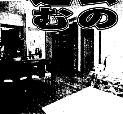
マイホームの夢を食いものに(本文と写真は関係ありません)

強い地震がきたらいつ んに倒壊しますよと脅 す。傷みが見つからな と、屋根の上でカワラ を自ら割り、「ほら、カ ワラがいへつと割れてい るの、ほつと雨漏 りしますよ」とい りながら「おうち つくるのは、作業服や 制服姿の営業マンを装っ た詐欺師。「無料で住宅 の点検をします」と言っ て家屋を見て回り、わず かな傷みを見つけて「基 礎にひびが入っています、 このした悪徳業者たち を、何度も力玉にする の知識があれば驚か なれませんが」 は、マユツバ。そこ だと思ふのだ。つ が、何としてね。 もマイホーム 決ま を持ちたい。それ 「サラリーマン 物、何でも同じよ は、こんな話 れをケースにしま と勧め、ここ が、案内された物件 るこの手の広告には、 こんな裏がある。「チ ンスン」とはか 屋に電話をかけると、 ずこう誘われるはずだ。 「ああ、あの物件で ています。でも、まだ 正式契約には至って せん。どうですか、一 度がほとんどである