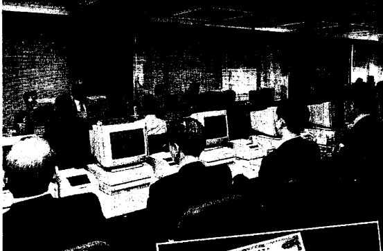
株式会社「マザーズ」と株券