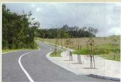
(団地のエントランス)