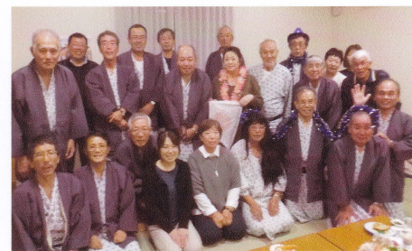
懇親会（阿字ヶ浦の民宿）

茨城の魚 楽しい秋の二日旅で した。私にとつて特に 楽しかったのは二日目の 「めんたいパーク」、