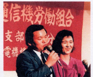
江井さんと一緒に

抜き太ももに大きな青あ ざをでかした〇〇さん。 顕微鏡を覗きながら居 眠りをして髪の毛を焦が した〇〇さん。お元気で すか？