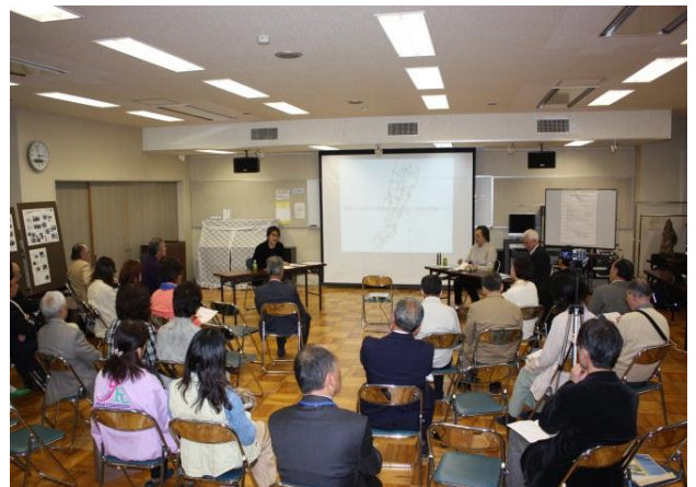
▲平成24年度（第17回）表彰式の様子