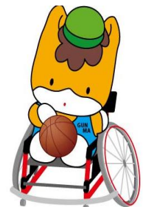
群馬県のマスコット