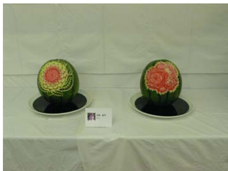
ベジタブルカービング