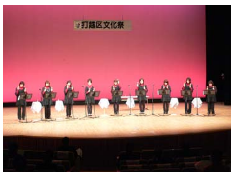
ハンドベル（ティンクルベル）