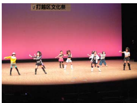
アメリカンヒップホップ