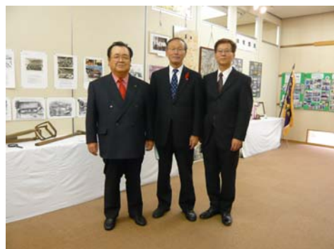
町長もお見えになりました