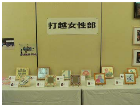
絵付けタイル（女性部）