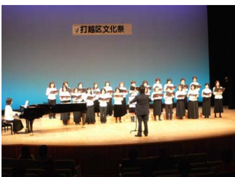
コーラス（コール・こすもす）