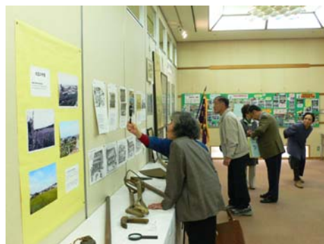
50年前の打越の前で