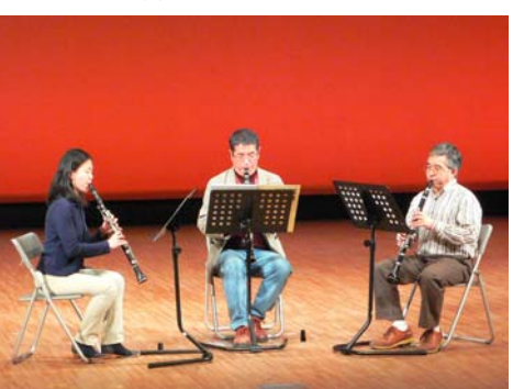
クラリネット演奏