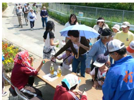
第二チェックポイント