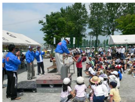
特賞が当たりました