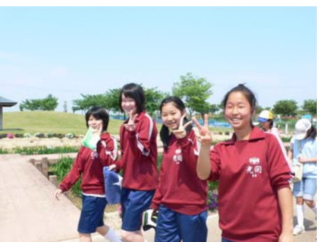
中学生も元気一杯