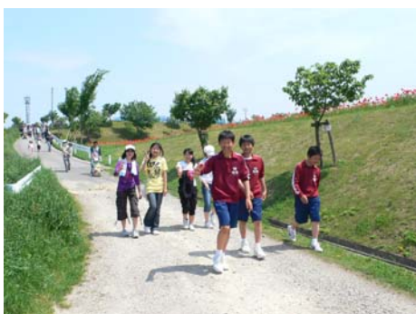
意外に仲がいいかも