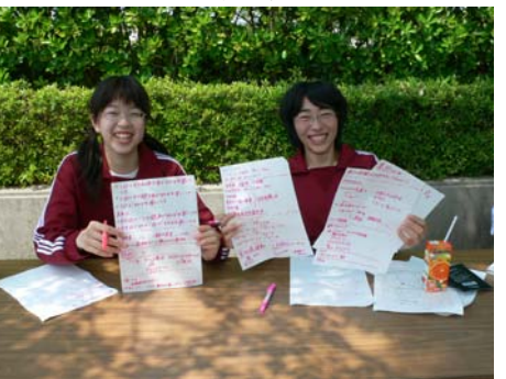
何なんだ!?この状況