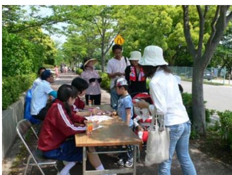
第四チェックポイント