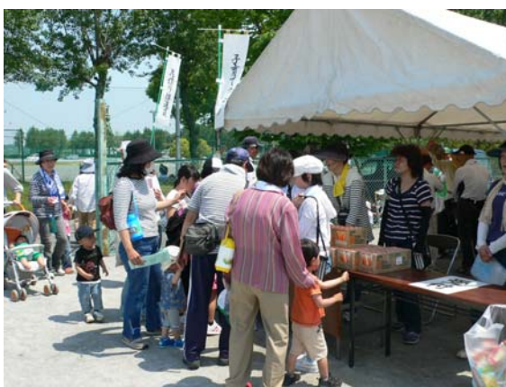
ゴールしました。お疲れ様