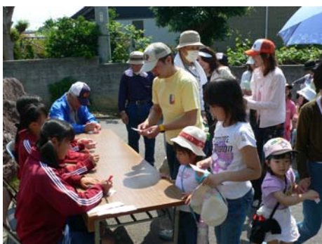
第一チェックポイント