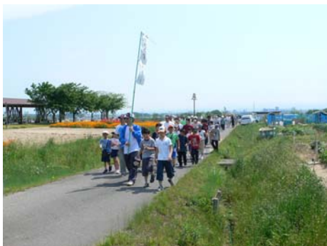
先頭がさんさんの郷を通過