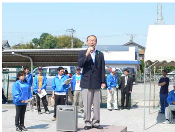
久野町長のあいさつ