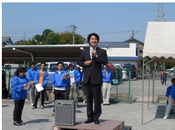
小山県議もお見えに