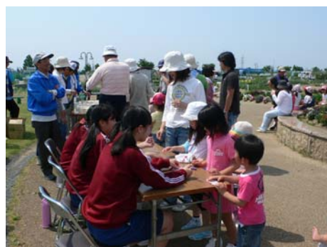
第三チェックポイント