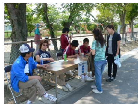
第五チェックポイント