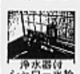
浄水器付 シャワー水栓