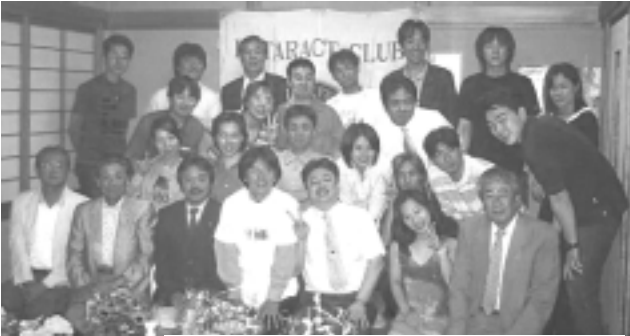
2001 - 2002年度松原ローターアクト納会にて

6月20日(木)午後7時30分より山崎屋におきまして、ローターアクトの本年度納会を行います。