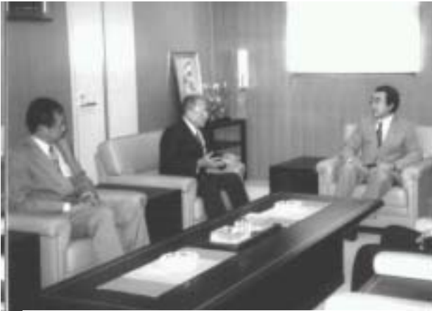
会長幹事の市長表敬訪問 7月5日(金)