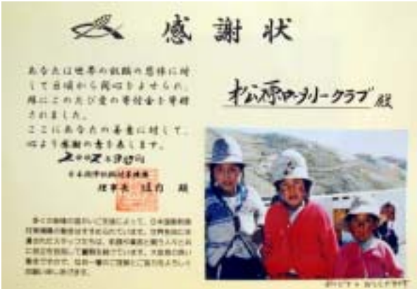
日本国際飢餓対策機構からの礼状