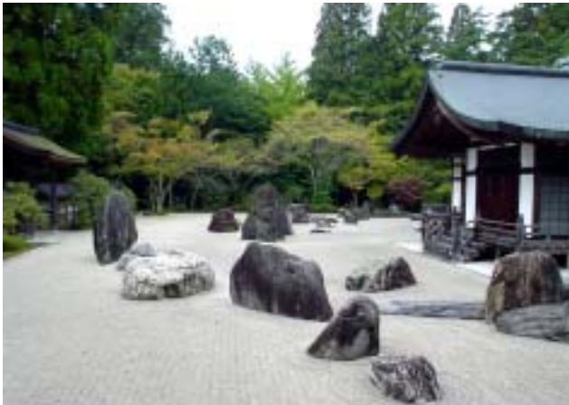
この石庭の、石の配置は二匹の龍を表す、とあったのですが、竜安寺のそれを出してみると少しばかり石の数が多いようです。然し、反面、それだからこそ眺める場所を選ばないのだそうです。