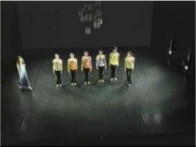
( 週報担当 会報委員会 )

私は、今まで私を含む韓国人があまり考えたことがなかった『日本人にとっての原爆』を作品に取り入れながら今の時代の現実を抱きしめ、これからの両国の行き方についての私の考察を表現します。