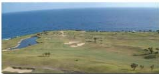
ザ・サザンリンクスゴルフクラブの風景

なお、詳しくは事務所に案内を掲示しておきますのでご覧ください。一人でも多くの参加をお願い致します。