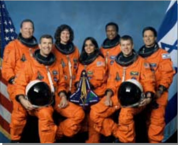
コロンビア号の事故で犠牲になった乗組員7人