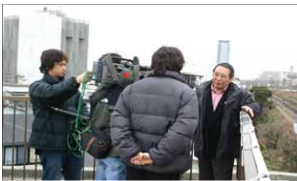
関西テレビも取材に来ました

19日はラストサンデー。吹田市内全域で大宣伝し、署名数は一挙に1万5千筆を越えるところまで。大型の宣伝カーが大通りを走り、自転車に積んだテレコで訴える「小型宣伝カー」が路地を歩き回る