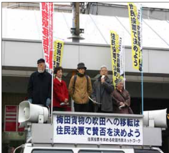
旭町商店街で訴えるネットワークのみなさん