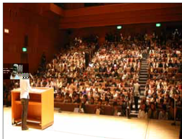
600の席が全て埋まり、 会場には立ち見の方も

議員へ、一言「ハガキ」を送る。議会開催日 4月17日（水）の昼 休日（26日）に は、大規模な市役所前 模範所前 役所前 宣伝を 行う。 聴する。 7時から吹田市市民 会館で報告集会を行 う。ことが確認され た。