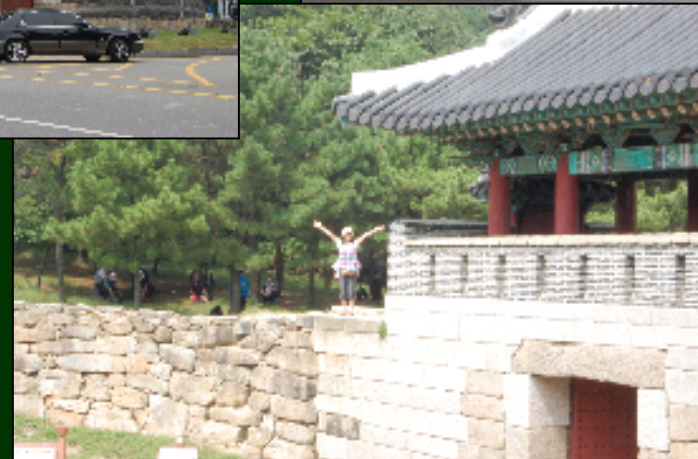
↑ 金井山城 南門