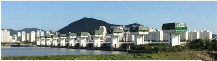
ナクトンガン河口堰