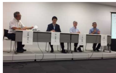
8/31 第3回長良川連続講座