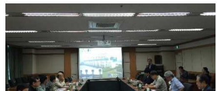
10/10 釜山広域市河川再生推進団の説明