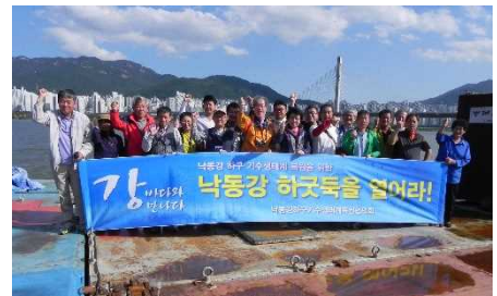
10/9 釜山の市民団体や漁民とエール交換

10日は釜山広域市庁で、河川再生推進団から取り組みの説明を受け、午後、推進団長ほか職員の皆さんの案内で河口堰や取水施設の見学をしました。今回の旅は、河口堰開放に向けた釜山の官民一体となった精力的な取り組みに、深く感銘する旅となりました。