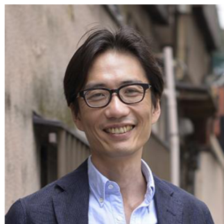
湯浅 誠 Makoto YUASA

社会活動家。1990年代より野宿者（ホームレス）支援に携わる。2008～09年年末年始の「年越し派遣村」では村長を務める。2009年から2012年まで通算2年間、内閣府参与を務める。東京大学大学院法学政治学研究科博士課程単位取得退学。1969年生。著書に『反貧困』（岩波新書、2008年、第14回平和・協同ジャーナリスト基金賞大賞、第8回大仏次郎論壇賞）、『どんとこい！貧困』（イーストプレス「よりみちパン！セ」シリーズ、2009年6月刊）、『ヒーローを待っていても世界は変わらない』（朝日新聞出版、2012年）など。