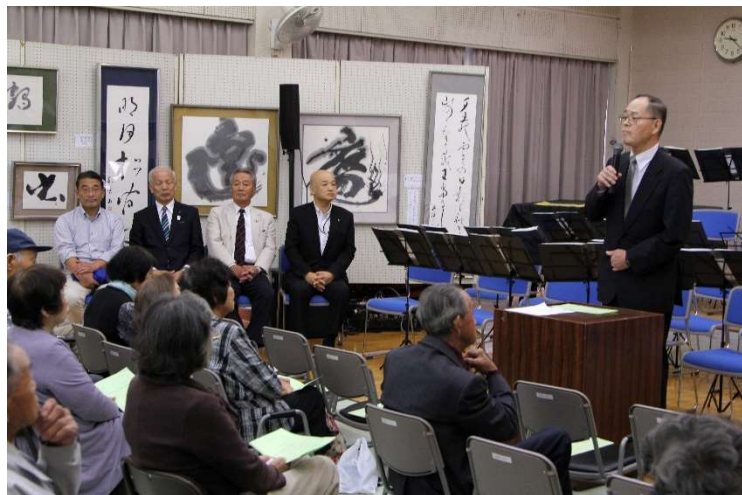
【敬老会】神門自治協会長の挨拶と来賓のみなさま

10月13日(土)と14日(日)の両日行われた出西地区文化祭の様子を以下にご紹介します。