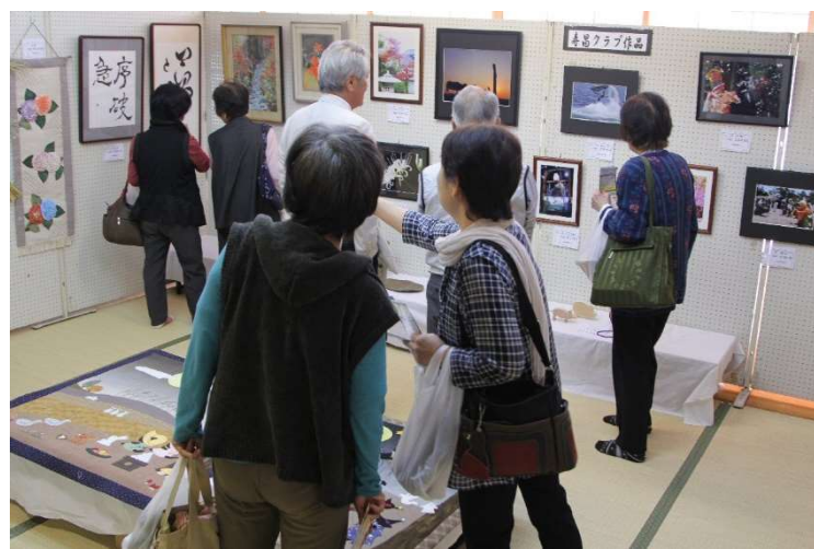
寿昌クラブの作品展