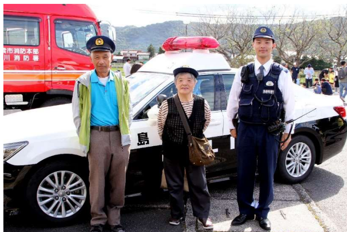
警察パトカーがやってきた・・・パトカーと記念写真