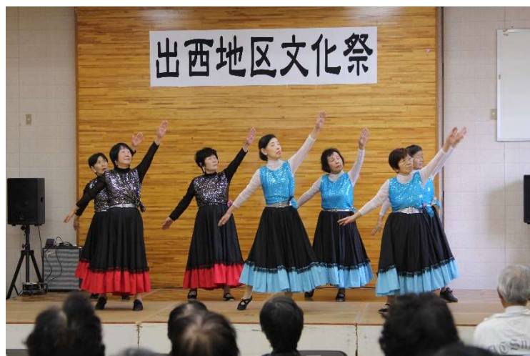
フォークダンス・クラブの皆さんの演技