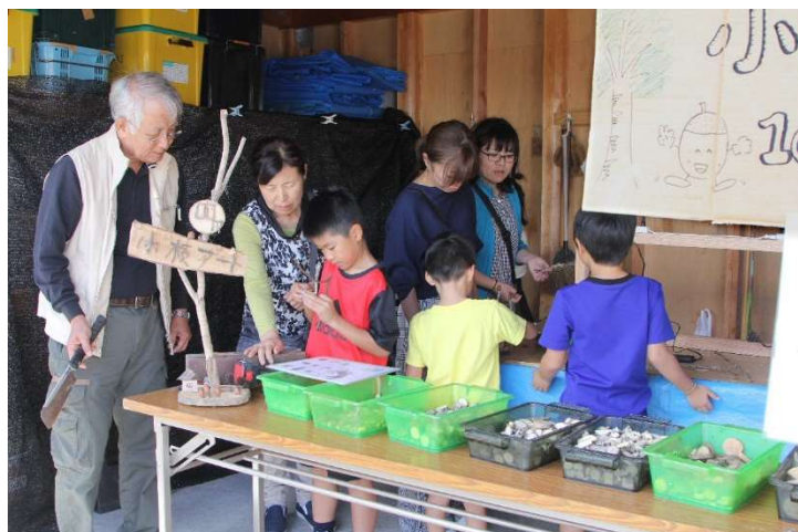
秋の自然体験広場・・・小枝を使ってオリジナル工作作り(初日)