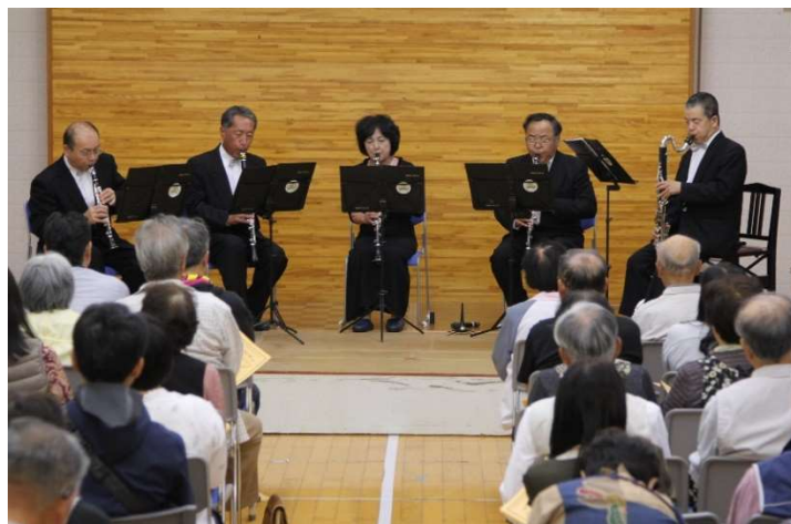
(新) スペシャルコンサート・・・シュネクラマテーレのクラ合奏