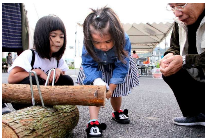
(新) 丸太きり体験(大谷里山の会)・・・わたしもがんばるゾ！