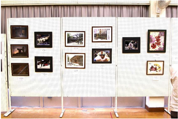
【一般出品による展示の部】 その1