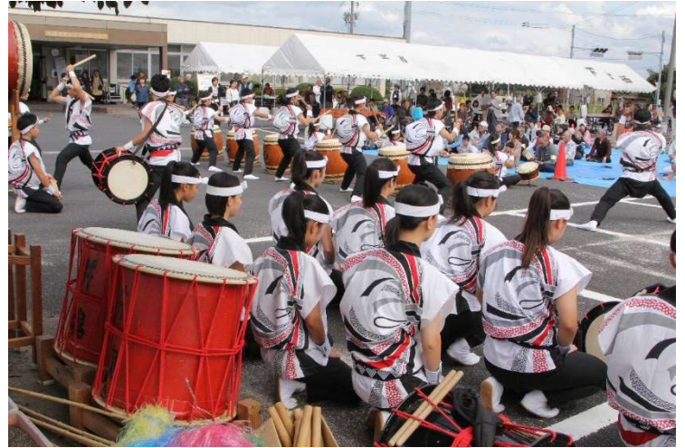
出雲農林高校の太鼓部の若さあふれる演技