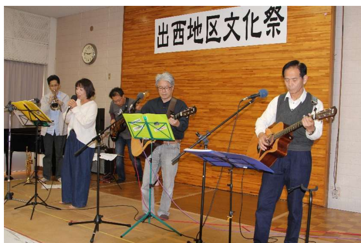
(新)オリジナル曲バンド「オリブス」の演奏