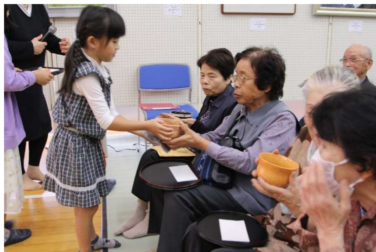
しばし休憩の合間に、抹茶のサービス(小学生茶道教室生)