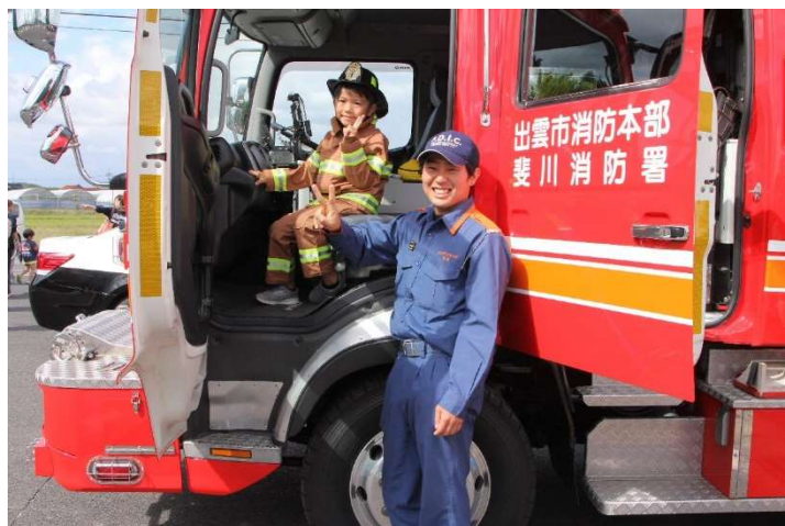
消防レスキュー車もやってきた・・・ぼく消防士！