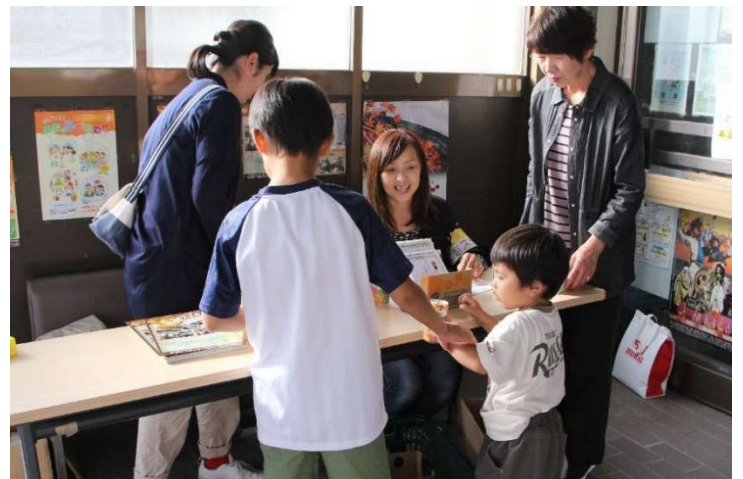
スタンプラリーの景品受け渡し所