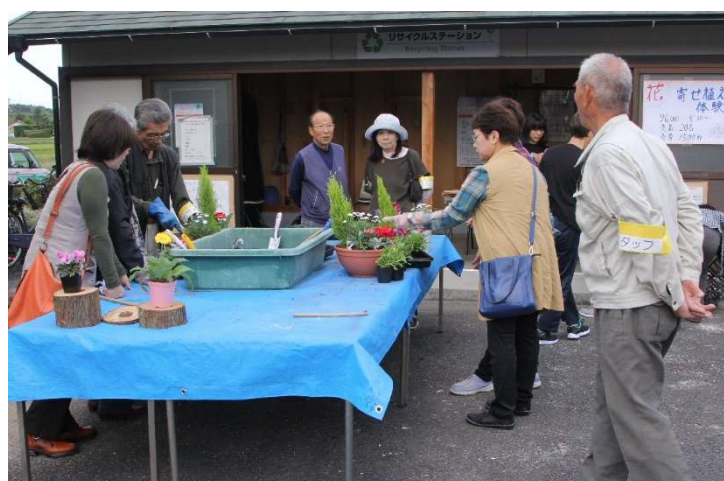
花の体験(寄せ植え)教室