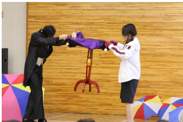
マジックショー、客席の飛び入りと一緒に...