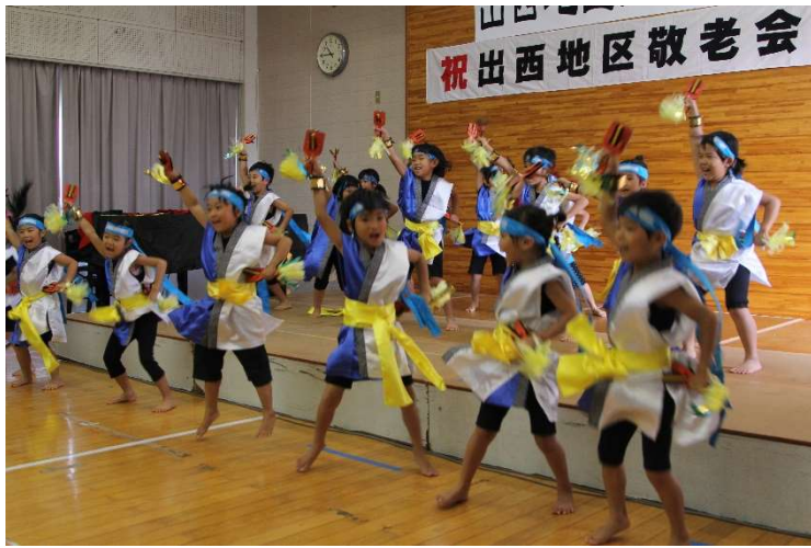
西野幼稚園のよさこい踊り(今年のよさこい祭りでキッズ賞受賞)