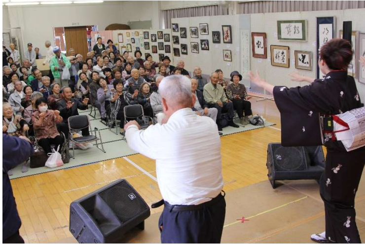
唱歌「ふるさと」の手振り踊りを習うスタッフ