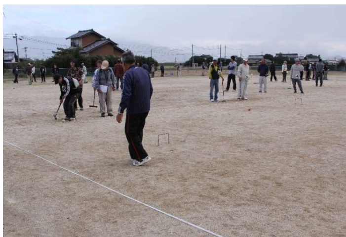
【14 日(日)2 日目】 第 25 回ふれあいゲートボール大会