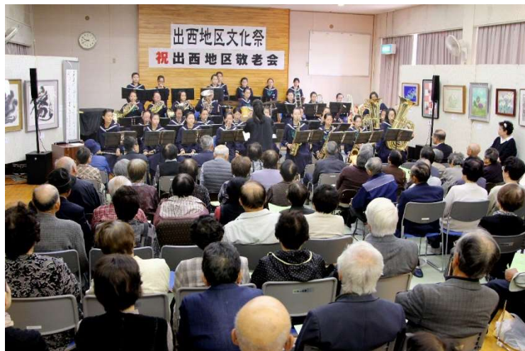
敬老会のオープニング、斐川西中学校 brass 部の演奏