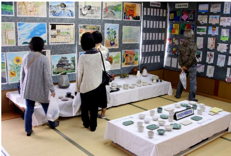
保、幼、小、中学校の子ども達の作品展