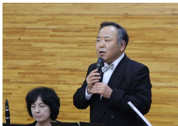
吉田さんのユーモアと巧みな司会に引き込まれて・・・