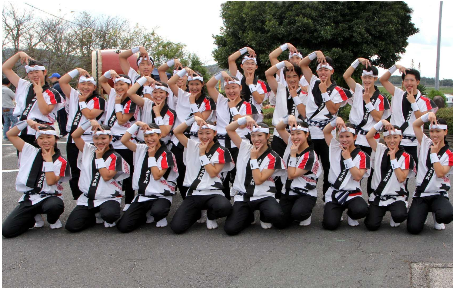
出雲農林高校太鼓部総勢 23 名のみなさん(演奏後の記念撮影で)・・・息もぴったり