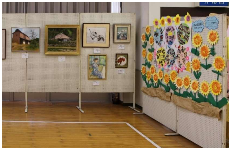
一般出品による展示の部 その4