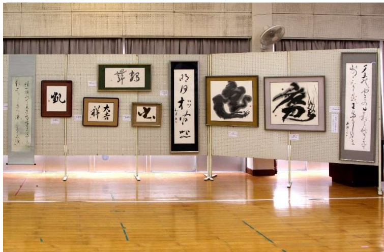
一般出品による展示の部 その2