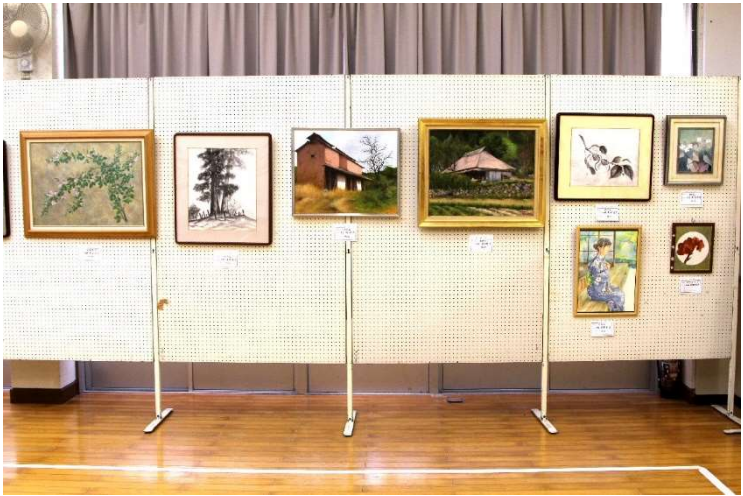
一般出品による展示の部 その3