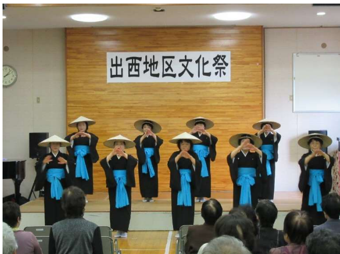
【13 日午後の部】 民謡