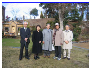
ネットの皆さんと