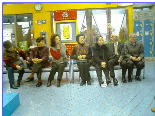
いささか疲れました