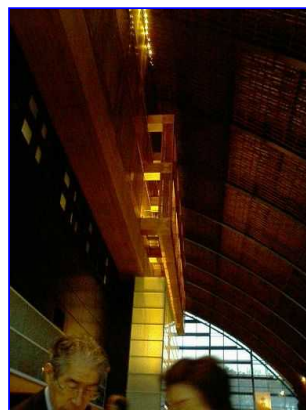
木造がふんだんに