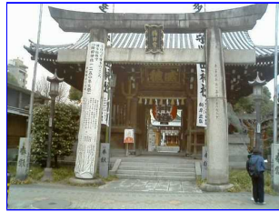
山門から本殿の望む