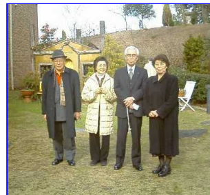
ネットの新会員さんと