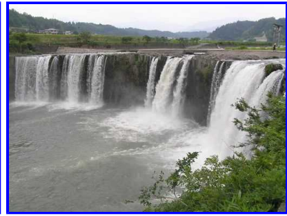
まだ勤勉の意欲満々

■故郷、大分県府のミニ同窓会みなさん来年の会に向けて練習をなさって、楽しくデュエットでもして下さい。同級生が集まるといつものことですが話が尽きず、時が経つのも忘れてしまいますね。♪早く来い来い古希の会・・・待ち遠しいですね。