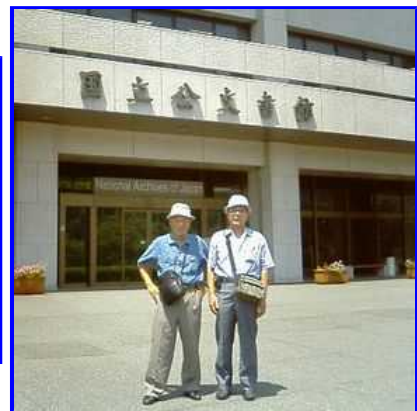
さて出かけますか