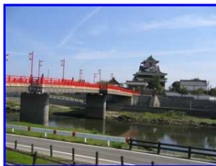
五条川の向こうに清洲城