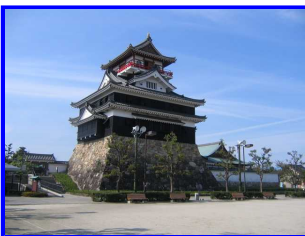
清洲の3層4階建て天守 閣

愛知の清洲城へ行ってきました。車でもよかったのですが、新幹線で名古屋まで行き名古屋から鈍行電車に乗り換え清洲駅からテクテク歩きました。詳しくは後ほど ウェブページ に載せますのでお待ちください。10, 25＝安則