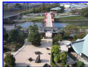
天守からの眺め城内と大 手橋