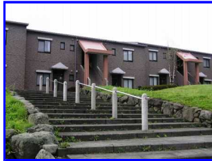
お世話になりました