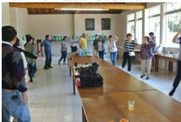
皆さんと一緒に郡上おどりを踊る