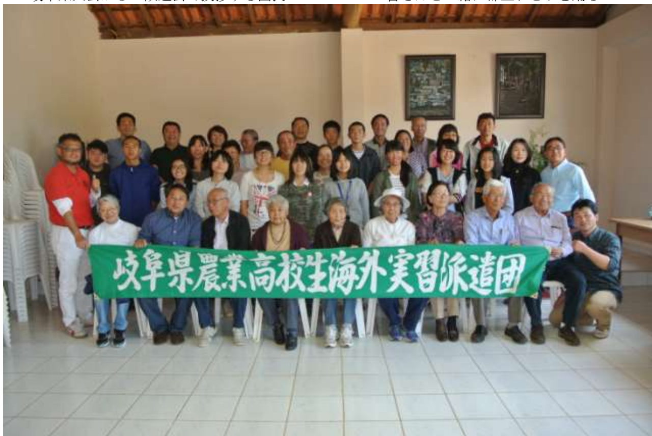
お世話になった農家の方々や岐阜県人会の方々と記念撮影