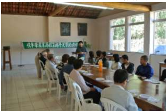
岐阜県人会からの歓迎会で挨拶する団長