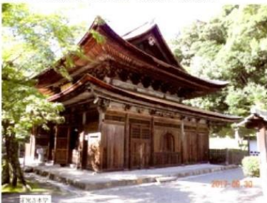
第1182回例会 山星山・高根山・定光寺