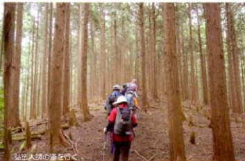
第1171回例会 茶畑と金胎寺、鷲峰山