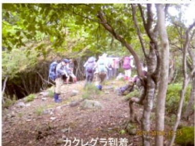
第1184回例会 スモトリコバ・入道ヶ原・カクレグラ