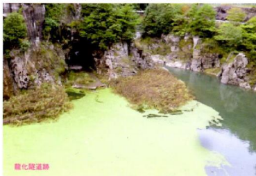
第1191回例会 雨森山から一庫ダム