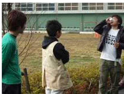
朝から青汁で乾杯 の ぷしゅ～ & ガチャピン