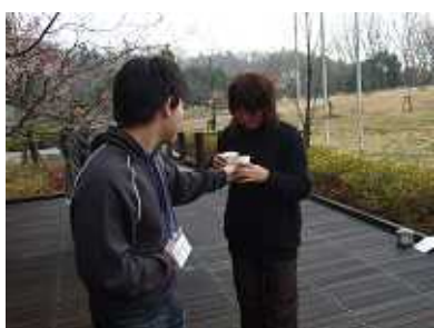
わかめも 一気にごくり