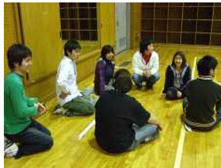
こちらはぴんきーず 両方ともユニークなチーム名だね(笑)