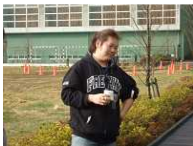
最初の犠牲者タッキー。 きっとそうだね・・・汗