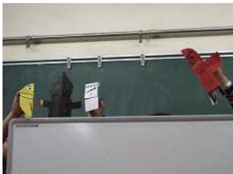
人形劇班2グループによる発表会