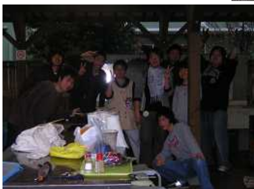
そして完成！！ 何ができたかはお楽しみ