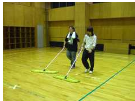
お掃除も忘れずにね