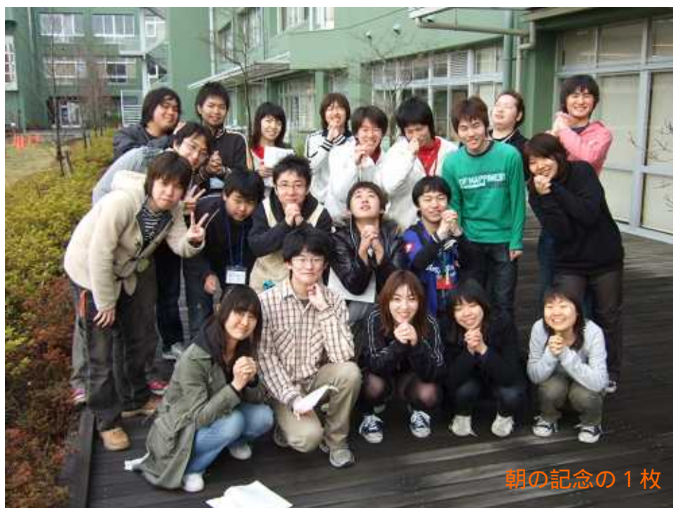
朝の記念の 1 枚