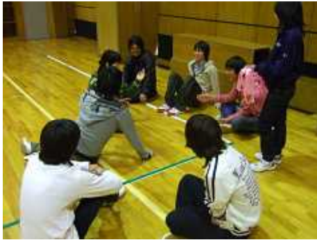
チーム・エクセルの面々