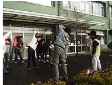
朝から元気にラジオ体操！！