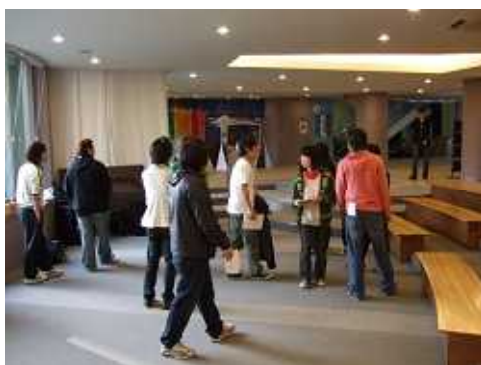
眠そうな顔をしながら、 集まり始めるみんな(-_ヾゴ'シゴ'シ