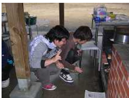
かっちゃんに火起こしを教えるいっち