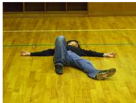
最後は皆でウルトラジャンプ！！