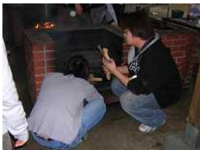
火起こし成功でピース( )v