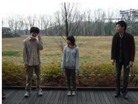
ぐるぐる、モリリン、かきおさん