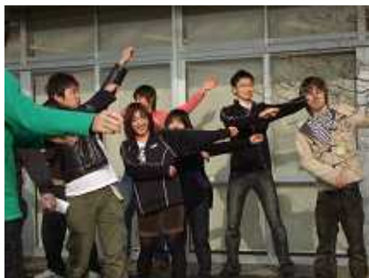
あれ？？ 何でラジオ体操で転ぶの？？(笑)