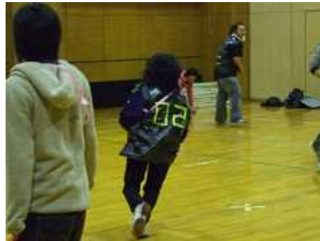
こらこら、その3人組ずるいですよ！！