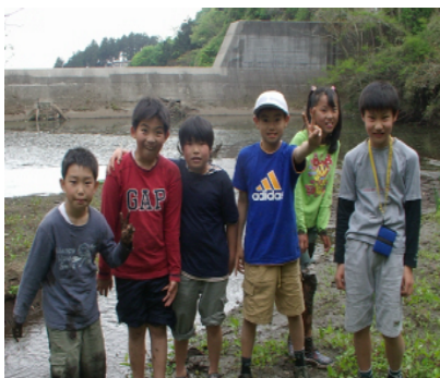
子供を対象にした秘境「滝沢川くだり」でダムまで行った

三子連や、ビオトープ大岩、寿会、交通安全協会などが協力して、五月晴れのもと、大岩堤のほとりで半日を楽しみ