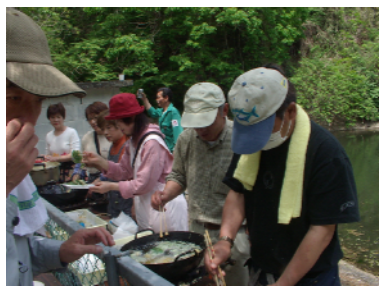
野草のてんぷらが無料でふるまわれた。

五月一日(日)に、大岩堤で「大岩堤祭」が実施されました。この祭は、堤を作った先人の努力に思いをはせつつ、大岩に残された自然を楽しむために行われています。