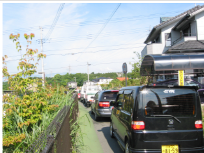
付近の道は抜け道になり渋滞

朝の、にいや商店付近の交通渋滞は誰もがなんとかならないか、と思っ ています。富士見小へ通 う子供たちも、ほとんど車と触