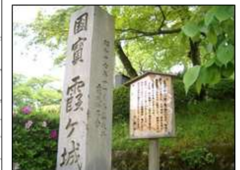
旧国宝 雷ヶ城の石碑