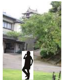
お天守広場中央から