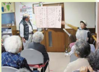
アコーディオン演奏 ボランティア