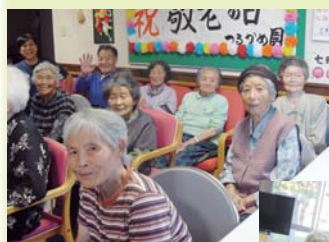
地域との 交流会の ひとこま