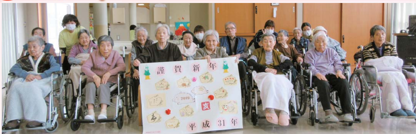
特別養護老人ホーム ほくほくの里