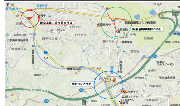
奈良総合医療センターへのアクセス路 概略図

2019年4月にネクスコ西日本へ移管予定である第二阪奈有料道路に関連した質問を致しました。今年の5月に救急救命センターを含む総合医療センターが中町に移転しており、阪奈道路からの救急アクセス路について 現地検証を行った上で、ネクスコとの協議内容を確認 。更に本来なら460円に値上げとなる小瀬―宝来間が緩和措置として現行の260円に維持されるとの事であるが、 現時点での協議事項に緩和措置期間が定められていない件について確認 を行いました。阪奈道路の渋滞緩和や中町フルランプ化についても移管前に将来を見据えた効果的な対応策を協議すべきとして質疑を行いました。