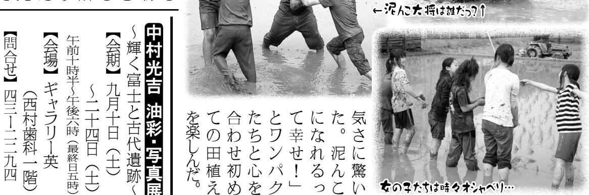
←泥んこ大将は誰だ?↑ 女の子たちは時々オシャベリ...

宝小学校恒例のお田植え(六月十四日)が行われ、五年生(18名)が近くの田んぼで精を出した。