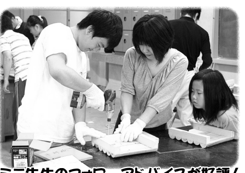
ミニ先生のフォロー、アドバイスが好評!