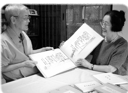
詩画集『くらしの中で』