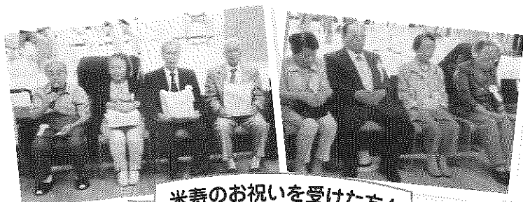
米寿のお祝いを受けた方々

談・コント、プロ歌手の歌謡ショー、各単ク代表21名とプロ歌手9名が紅白に分かれて歌合戦。いずれがプロかと思っほど皆上手で大いに楽しめました。観客の拍手で紅組女性軍の勝利でした。