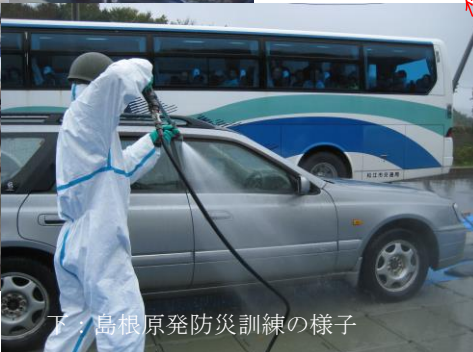
下：島根原発防災訓練の様子