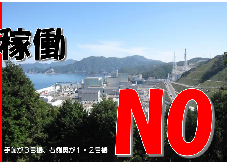
手前が3号機、右側奥が1・2号機

島根原発は、宍道湖の北側の日本海に面し、山を切り崩し3基が建設されています。島根原発1号機は、2011年3月11日に大事故を起こした福島第一原発1号機と同じ型の原発です。原発から島根県庁の在るところまで約10km、30km圏内には島根県内では松江市・出雲市・安来市・雲南市が在り、鳥取県内では境港市と米子市が在ります。60km圏内には広島県、岡山県が含まれます。