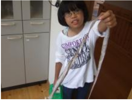
途中で蛇の抜け皮を発見 ↑