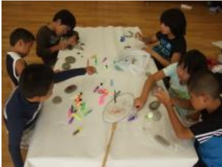
昨日、河原で拾った石に絵を描いていきます。