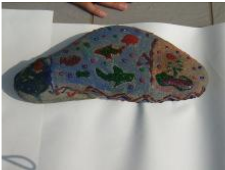
これは、海の様子ですね