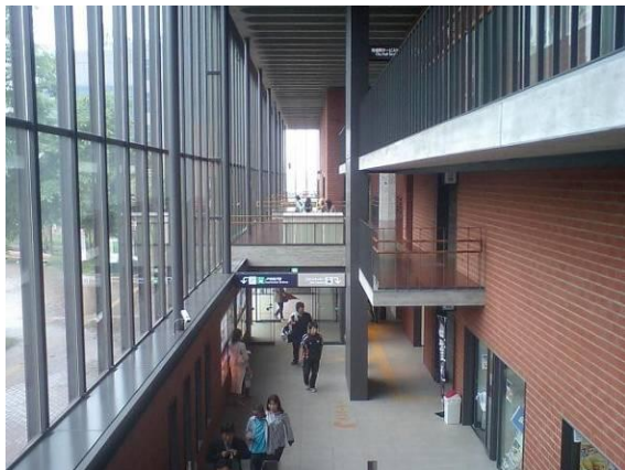
厳しい冬に備えた複合駅舎の内部空間

この駅は大々的な設計競技（JRグループ初の公開設計コンペ）を経て建てられたが、出来上がった建築は北欧の公共建築のように長く市民に愛される水準に達していると思った。さらに重要なことは、この駅は