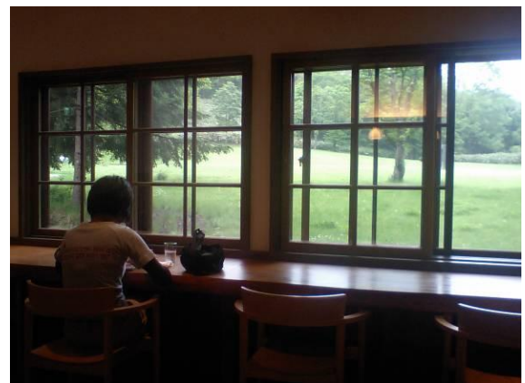
アルテピアッツァ美唄に流れる静かな時間