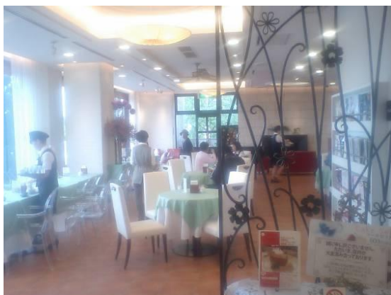
住民や観光客で賑わうスイートロードの北菓楼