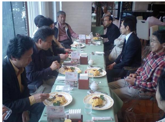
砂川スイートロードをじっくり味わう