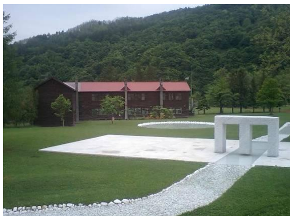
アルテピアッツァ美唄（校舎と校庭）