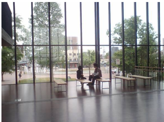
岩見沢複合駅舎は、街と外部の結節点

岩見沢も、砂川も、仕事とプライベートで2回ずつ訪れたことがあるのですが、もう20～30年も前のことです。久しぶりに来訪し、厳しい環境ながら、すばらしい複合駅舎や魅力的なスイートロードなど、着実な試みが進められていて好感が持てました。「伝統にとらわれない強い郷土愛」が北海道の持ち味だと思いますし、その良さが様々なところで見いだせました。とても充実した2日間でした。鈴木さん、本当にありがとうございました。（担当：大竹 亮）