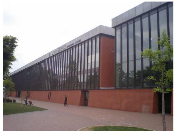
主要道路からの軸線を受け止める長大空間