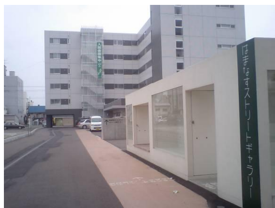
中心市街地のアーバンビレッジ岩見沢