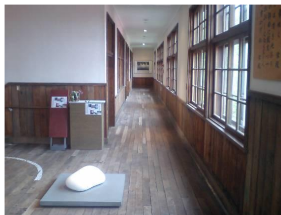
アルテピアッツァ美唄（校舎内部）