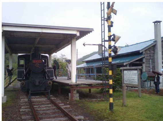
万字線廃線後に保存された旧朝日駅舎とSL