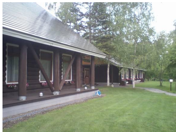
岩見沢市郊外のメープルロッジ