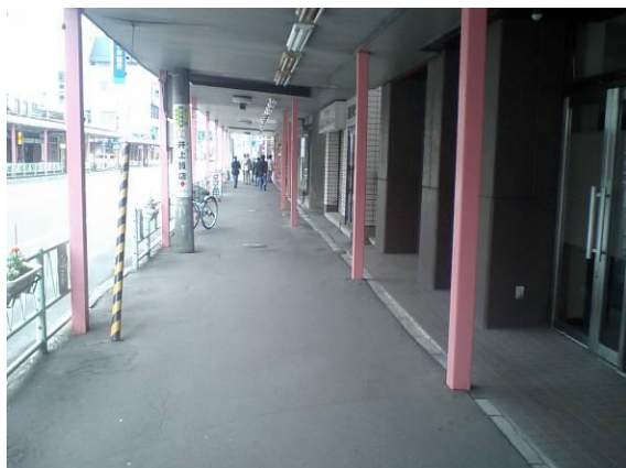
活性化を模索する岩見沢駅前の商店街

岩見沢市では、衰退した中心市街地の空き地や空き店舗を利用して多くの事業が推進されており、それらのいくつかの成果を、実際に町を散策して視察した。デパート跡地の朝市のできる交流広場や、ポケットパークのような町中ミュージアムなどの印象的な事業も興味深かったが、特にユニークな試みは「アーバンビレッジ岩見沢」という、音楽スタジオと学生向け賃貸マンションとシルバー人材センターの複合ビルを、特定目的会社をつくり建設したものであった。これは、音・美・体教育の北海道大学岩見沢分校があるこの地域の特色を生かした事業であり、このような若者やサブカルチャー支援の事業は、従来の中心市街地活性化にはあまり見られなかったもので、新鮮であった。しかし残念なことに、この事業での建築の計画や周辺との関係は、駅舎とその周辺のように優れた解決がなされていなかった。隣接地に大変魅力的な古くからの個店商店市場やコミュニティが残っており、そのようなものとの連動性があれば、複合的機能やオープンスペースのデザインなども、もっと魅力的なものになったと思えた。（岩見沢記録：二瓶正史）