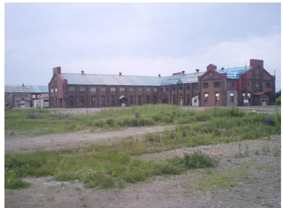
自由通路の先にある煉瓦造のレールセンター