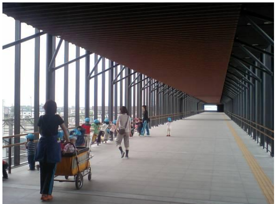
幅広い自由通路で子供たちも大喜び