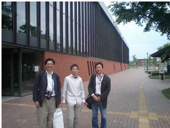
完成した岩見沢複合駅舎を見学する