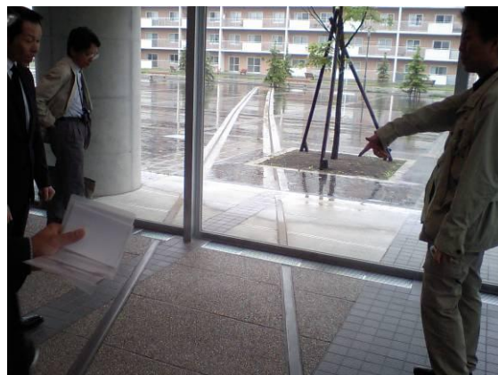
上砂川支線を記憶するモニュメント（砂川）