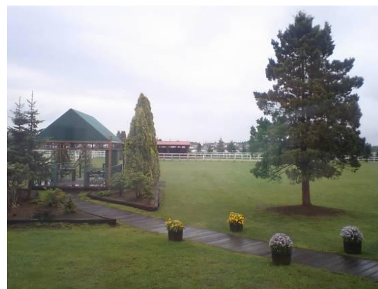
馬具・革製品ソメスサドルの牧場とショップ