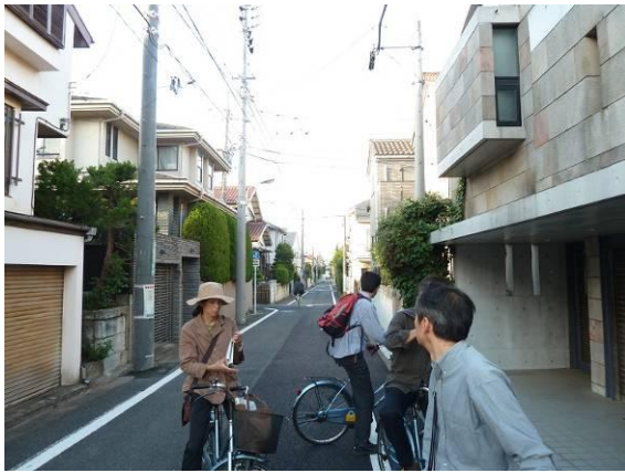
風致地区指定された大泉学園住宅地（練馬区側）

C：範囲が広いため、街並みが守られているところと、アパートや駐車場が入り込んでいるところがあり、一律の評価は難しい。