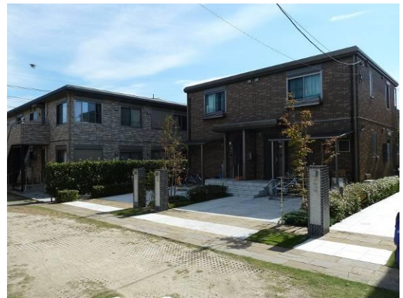
農住共生を試みるインザファーム（住宅部分）