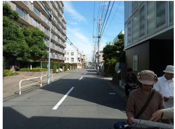
細分化や高層化が進む大泉学園住宅地（新座市側）