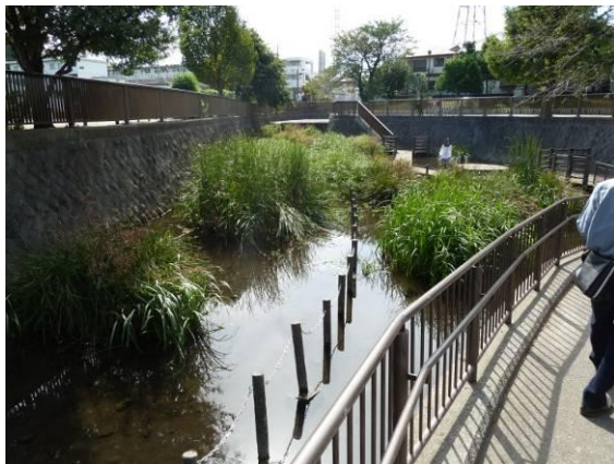
清流を取り戻した白子川源流・井頭公園

C：水辺の会の源流保存活動は大変なことであり、高く評価されるべきことであるが、源流部は整備されすぎていて自然な感じが少ないと思った。また大雨時に汚水が放流され水質もあまり良くないということなので、本当の自然の美しさとは少し離れていると思った。