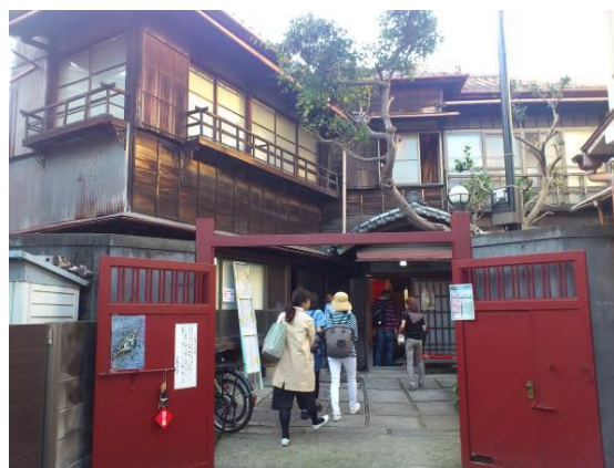
旧状が良く残されている旧平櫛田中邸アトリエ