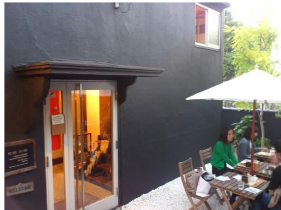
学生アパートをリノベーションしたHAGISO