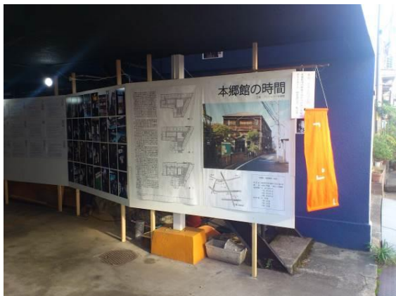
関係者が芸工展に参加した「本郷館の時間」