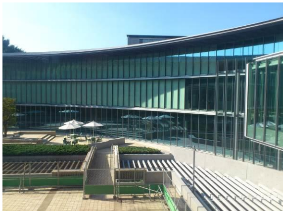
新棟が増築された国際子ども図書館