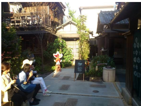
戦前木造住宅3棟リノベーションの上野桜木あたり

企画主旨■上野公園の文化施設ゾーンから続く谷中の寺町は、路地に長屋が連なる庶民的な町でありながら、芸大ゆかりのアーティストが活動する場でもあります。そうした伝統を踏まえ、恒例の芸工展が今年も谷中で開催されます。今回もたくさんのお店やギャラリー、アトリエや住居で、多彩な企画が用意されています。その数、なんと93！まちじゅうが展覧会場です！当日会場で公式ガイドマップを購入して、マップ片手に谷中の寺町や路地、坂道と一緒に歩きましょう。そして、町家や長屋が連なるこの町の独特の味わいを感じ取り、今後のまちづくりの方向を考えてみましょう。