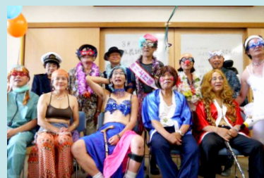
▲ 納涼仮装大会 (2014)