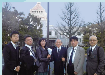
▲ 国会議員に陳情活動 (2016)