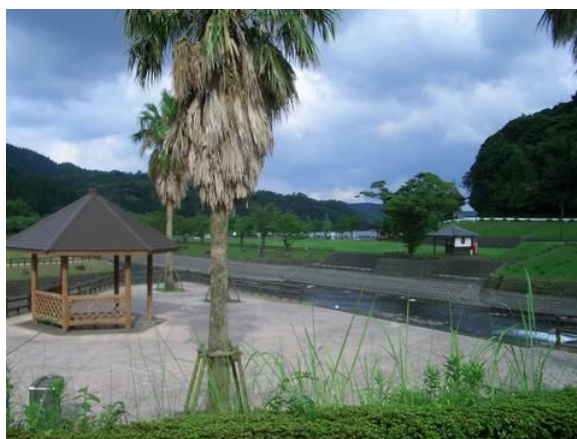
KAPIC の周りの伝説の川