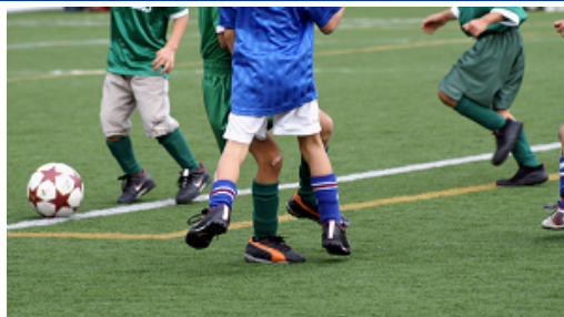
子どもたちに芝のグラウンドを！