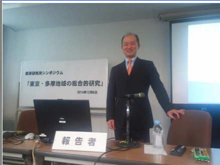
中央大学経済研究所・客員研究員に

青梅市議会議員の活動をしている中で、中央大学経済研究所よりお誘いをいただきました。現在、 地域経済の専門家として、客員研究員を務めています。