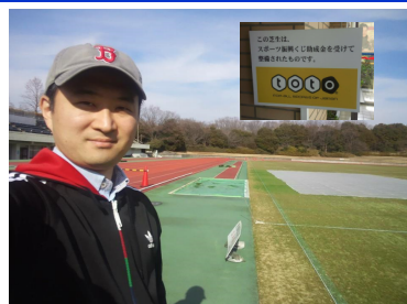
totoで整備された多摩市立陸上競技場

totoの助成金を使った競技場の整備の事例を見に行きました。スポーツは重要です。青少年の育成や地域のレクリエーションなど、コミュニティを形成する役割があります。その基礎となる スポーツ環境の整備は、青梅市にとって大きな課題です。引き続き環境の整備に向けた活動を進めます。