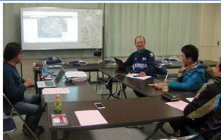
青梅市サッカー協会 グラウンド建設委員会の様子

青梅市サッカー協会のグラウンド建設委員会の委員長に就任しました。青梅市には天然芝や人工芝を有する公式のサッカー場がなく、大会を開催する会場や練習の環境が十分ではありません。 子どもから大人まで青梅市民が楽しめるサッカーグラウンドの建設に向けて動き出しました。 青梅市サッカー協会の今後の活動にご注目ください。