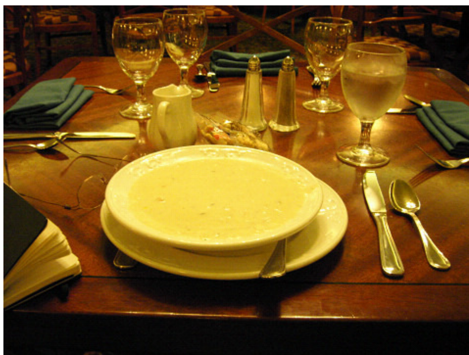
ランチ クラムチャウダー 家で食べるクリームシチューより多いくらいの量！