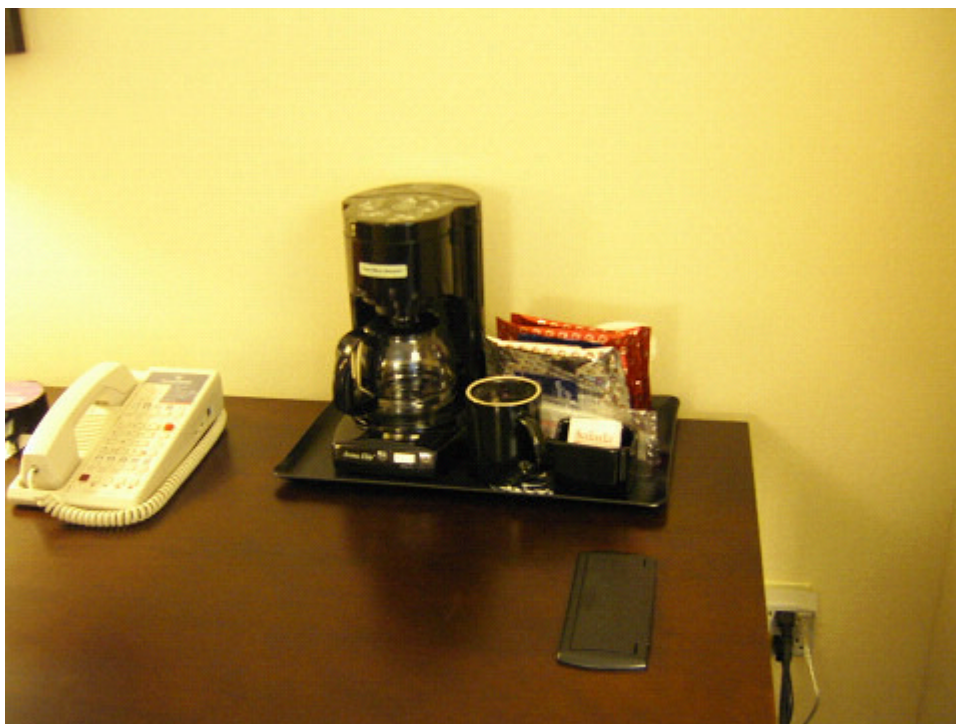
机の上のコーヒーマーカー