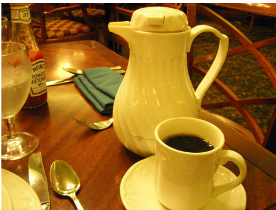
コーヒーはポットに入れてくる 3杯はある