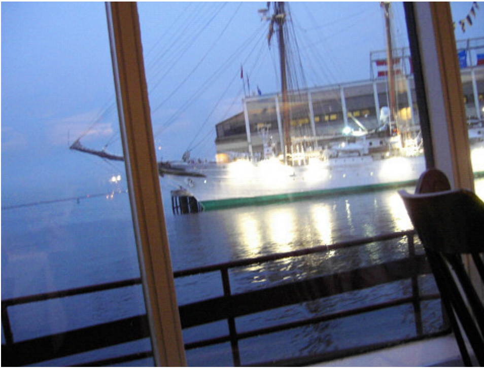
クルーズが出たり入ったり 霧が濃い夜でした frog