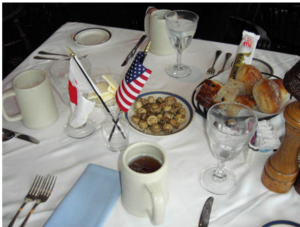
Harpoon steinというボストンビールで乾杯 日本人なれしているウェーターが旗を用意