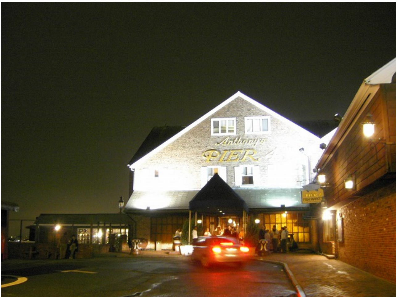
Anthony's Pier 4というシーフードレストランに予約を入れ、先生とdinner