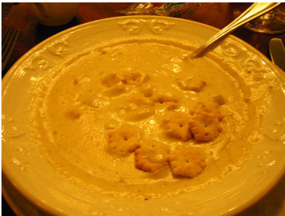
クラッカーを入れて食べました