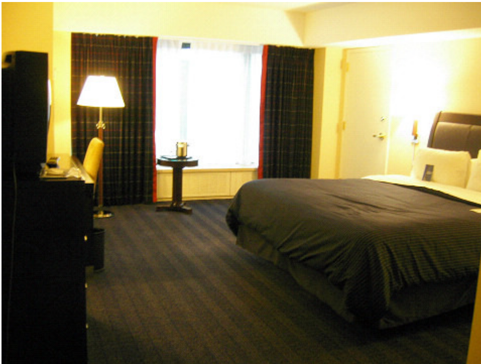
ホテルに入ったところ