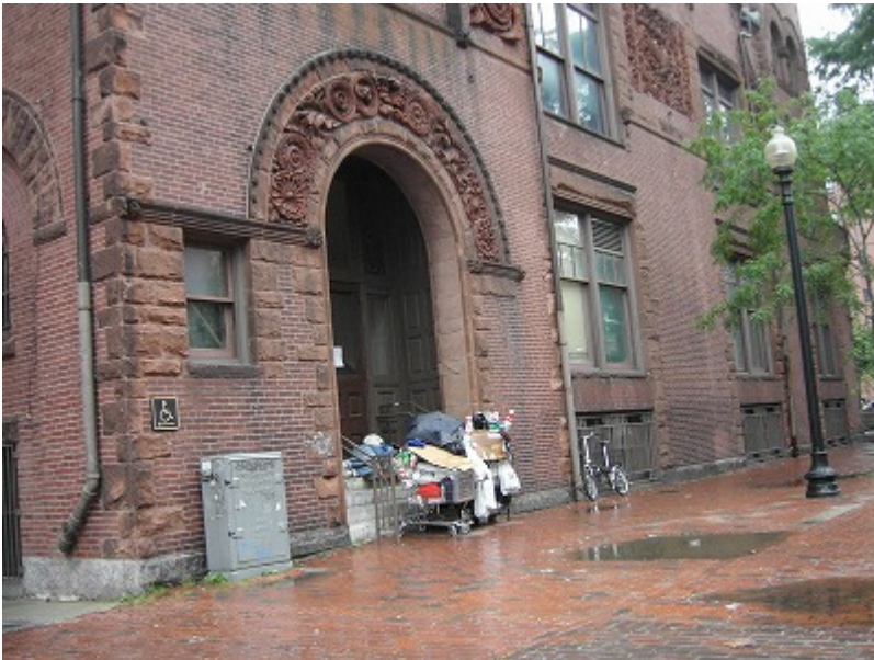
ボストンにも浮浪者が