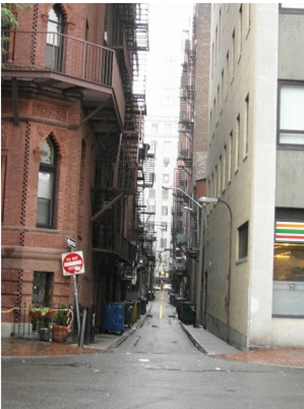
映画に出てきそうな裏路地。