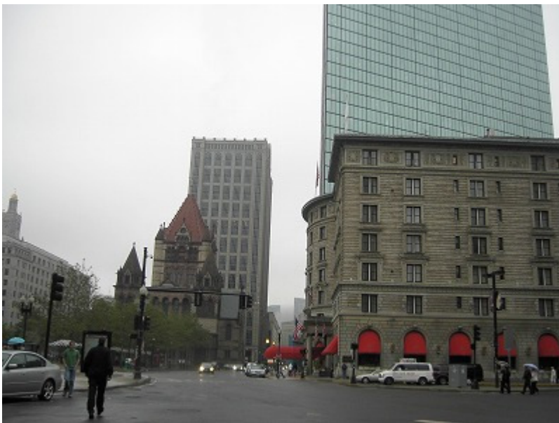
教会と超高層ビル