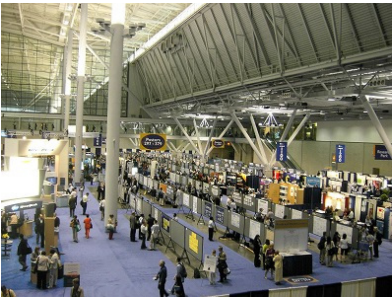
ポスター、機器展示会場は巨大。メガファーマとよばれるクラスの製薬会社は展示物も違う