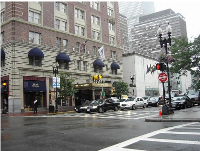
クラクションを鳴らしながらポルトガルの旗を振る若者たちの車