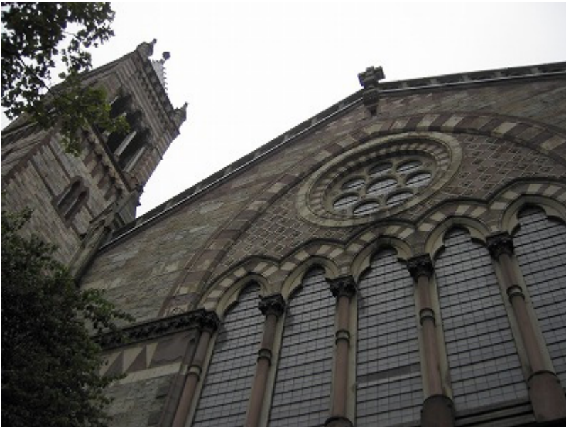
いたるところに教会