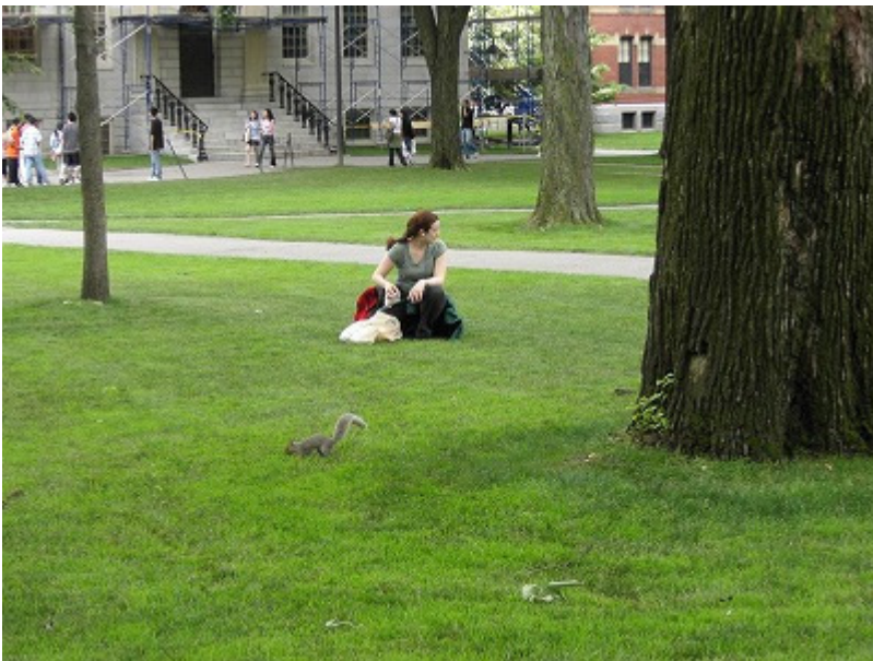
キャンパス内にリスが普通にるのが普通でない。