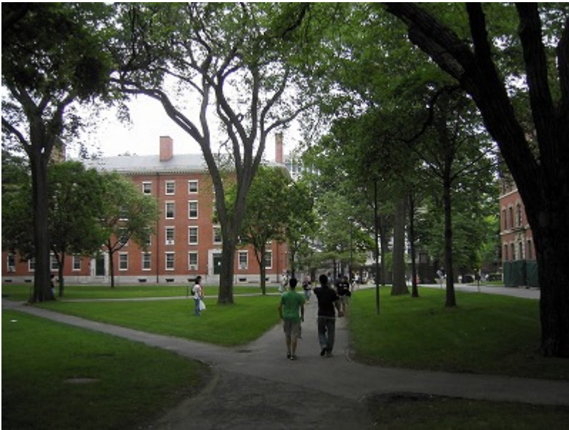
ハーバード大学のキャンパス、ハーバードヤード。