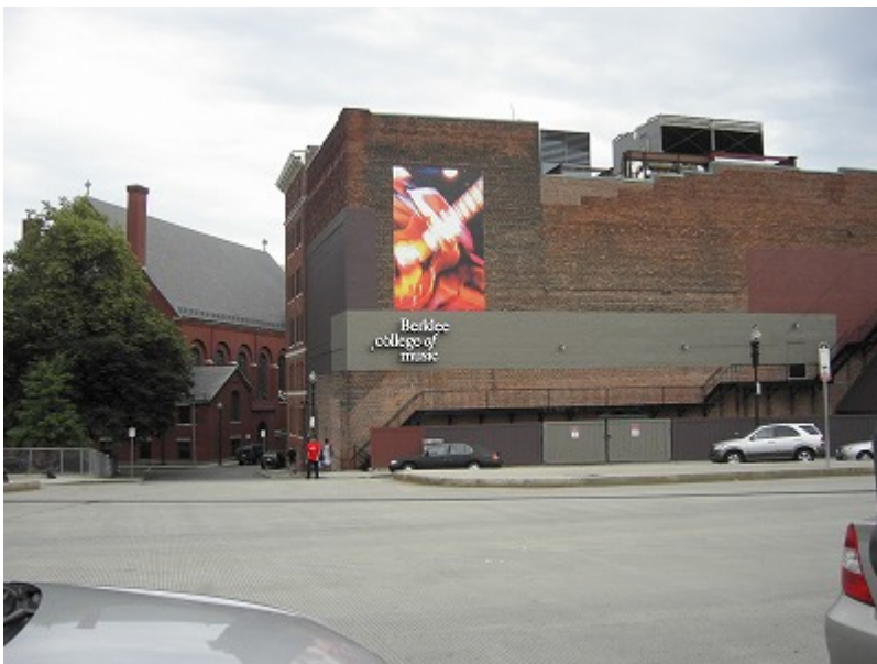
バークレー音楽学院