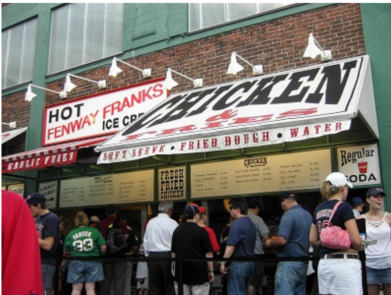
ここの来れば、球場名物フェンウェイ・フランク스를食べないといけません