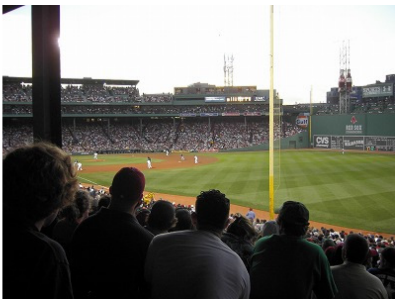
柱と人間でバッターが...