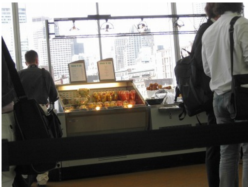
学会も最終日となると、さっぱりしたフルーツ系が人気