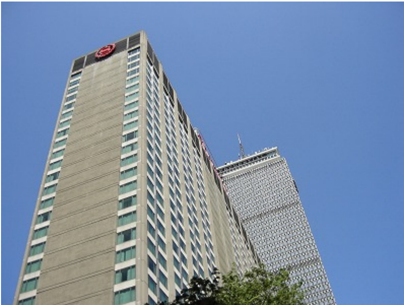
シェラトンホテルとプルデンシャルセンター