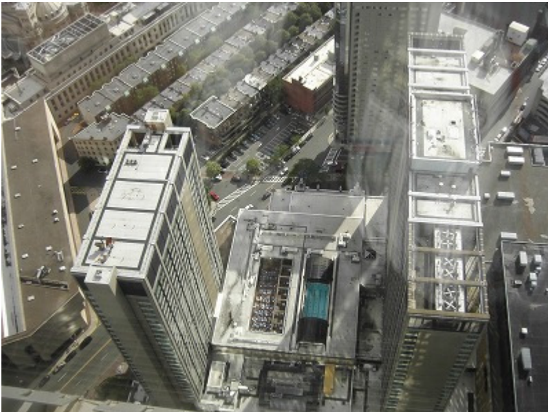
シェラトンホテルサウスタワー(左、宿泊したところ)とノースタワー 中央にはプールが。結局入らなかった。