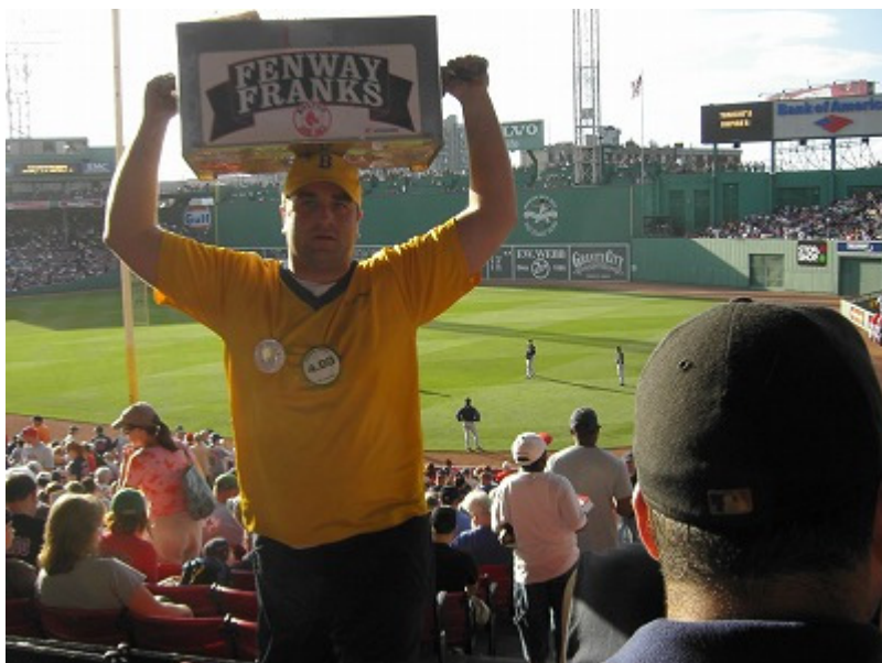
売り子も元気です