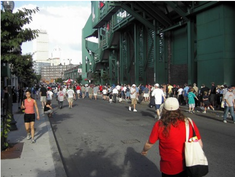
フェンウェイパーク グリーンモンスター外側。試合前から騒々しい