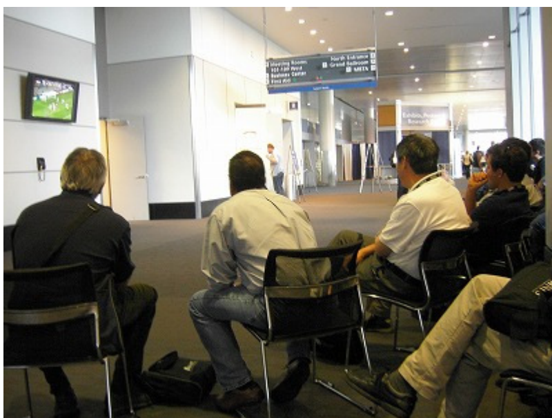
ほとんどの演題が終わり、真剣にワールドカップに見入る参加者