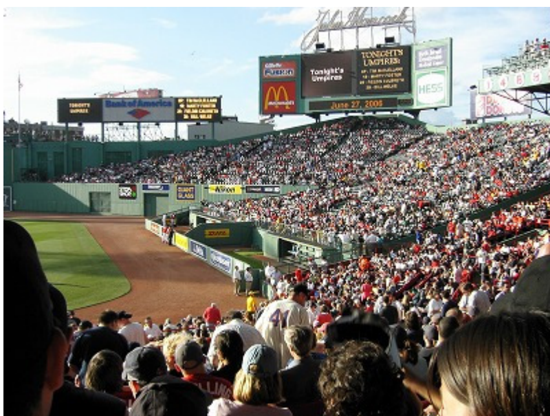
試合開始前から盛り上がりおりました