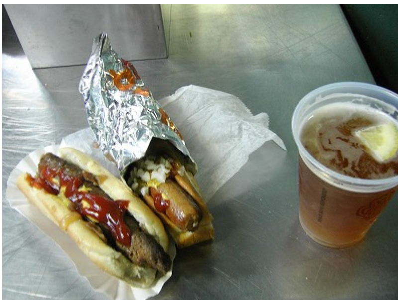
2種類もかってしまいました。ラガービールと