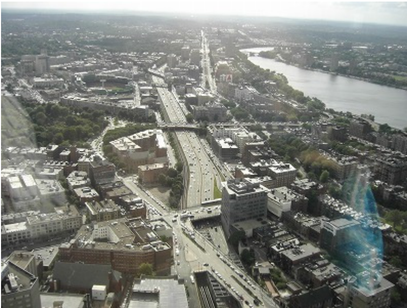
左上にフェンウェイパークが見える