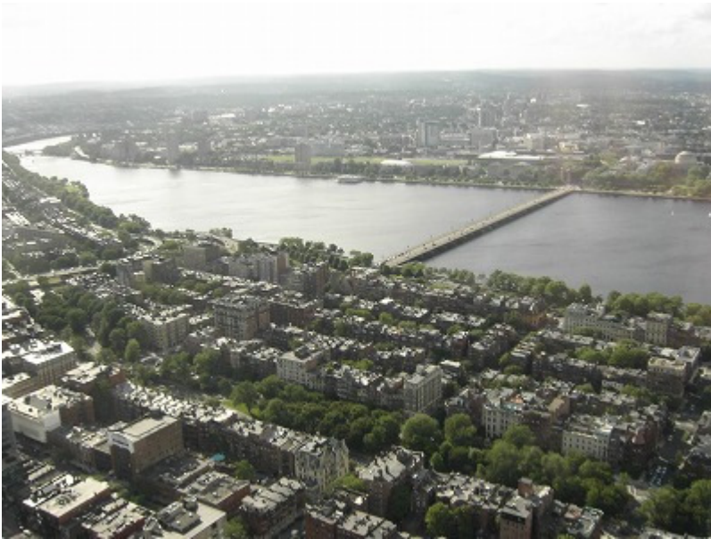
チャールズリバー北側はMITやハーバード大学