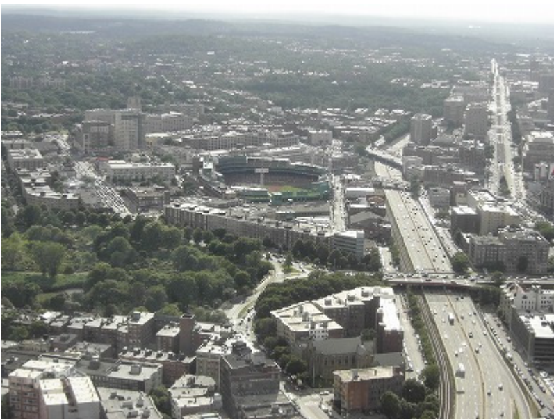
フェンウェイパーク