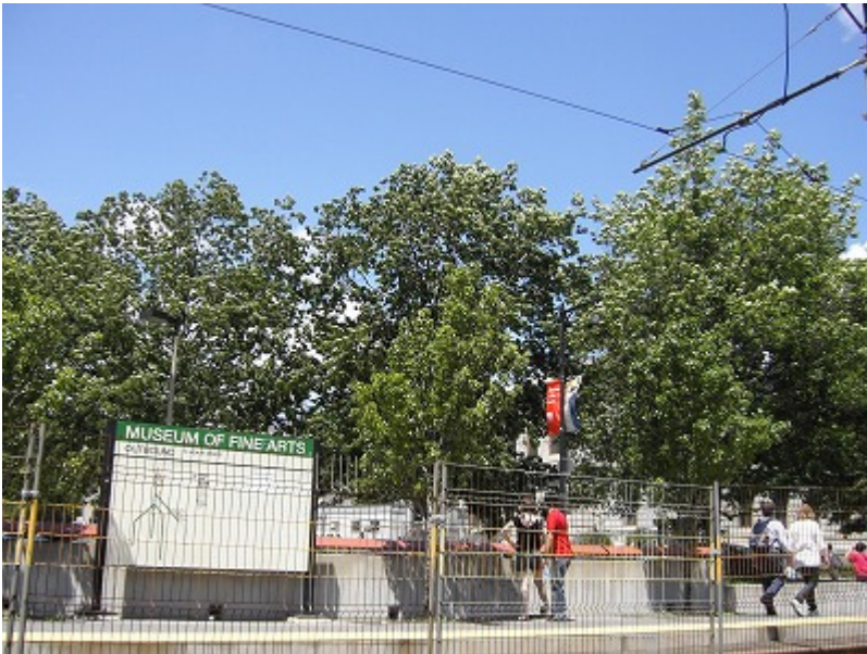
最寄の駅は地上駅