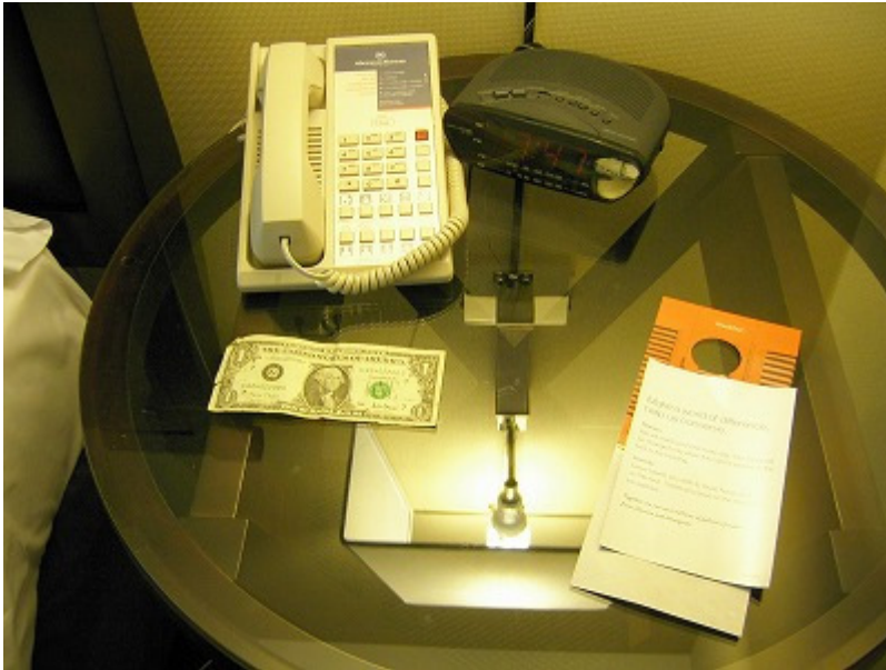
ベッドサイドチップ