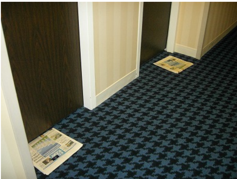
毎朝こんな感じでUSA TODAY新聞が来る