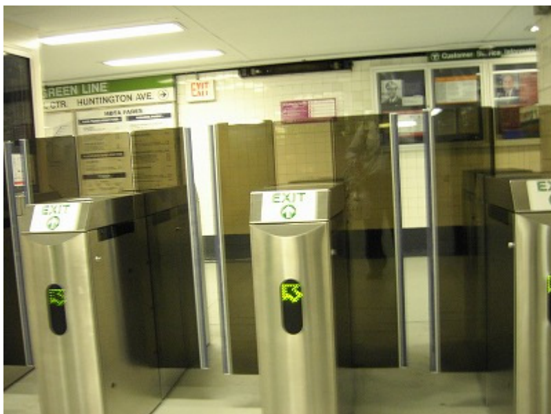
地下鉄出口。出るときはコインやカードはいらない