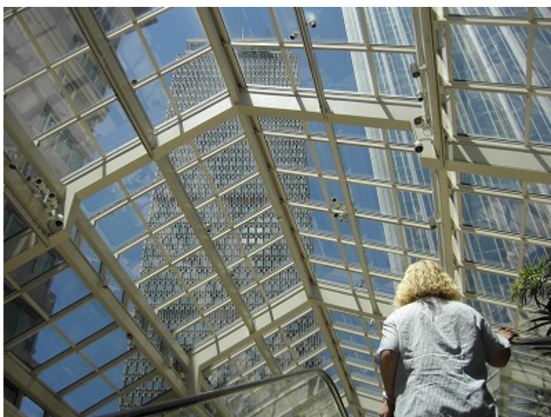
プルデンシャルセンター