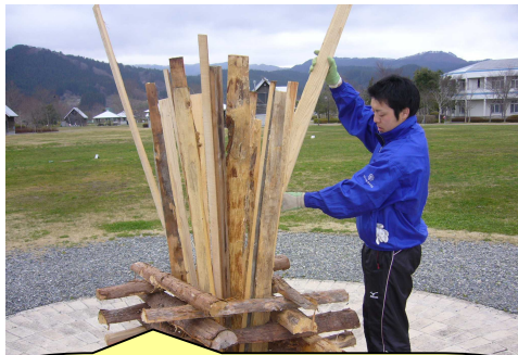
背板を入れます。大 25 枚、中 15 枚、小 10 枚