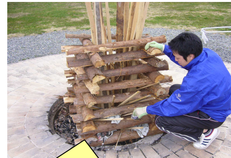
薪と新聞紙を入れます。丸太の間(2 段目か 3 段目に)