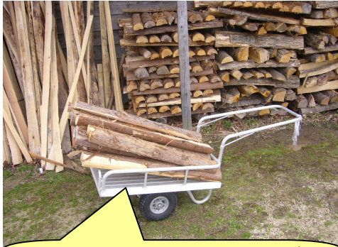
倉庫裏からリヤカーで丸太を運びます。