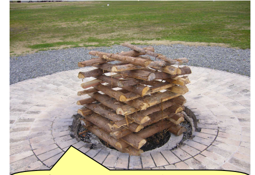
バランスよく積み上げます。大 40 本、中 30 本。小 20 本