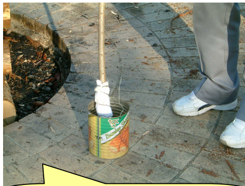
トーチを灯油に浸し、井桁や倉庫脇に逆さにして立てかけます。