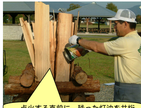
点火する直前に、残った灯油を井桁にかけます。