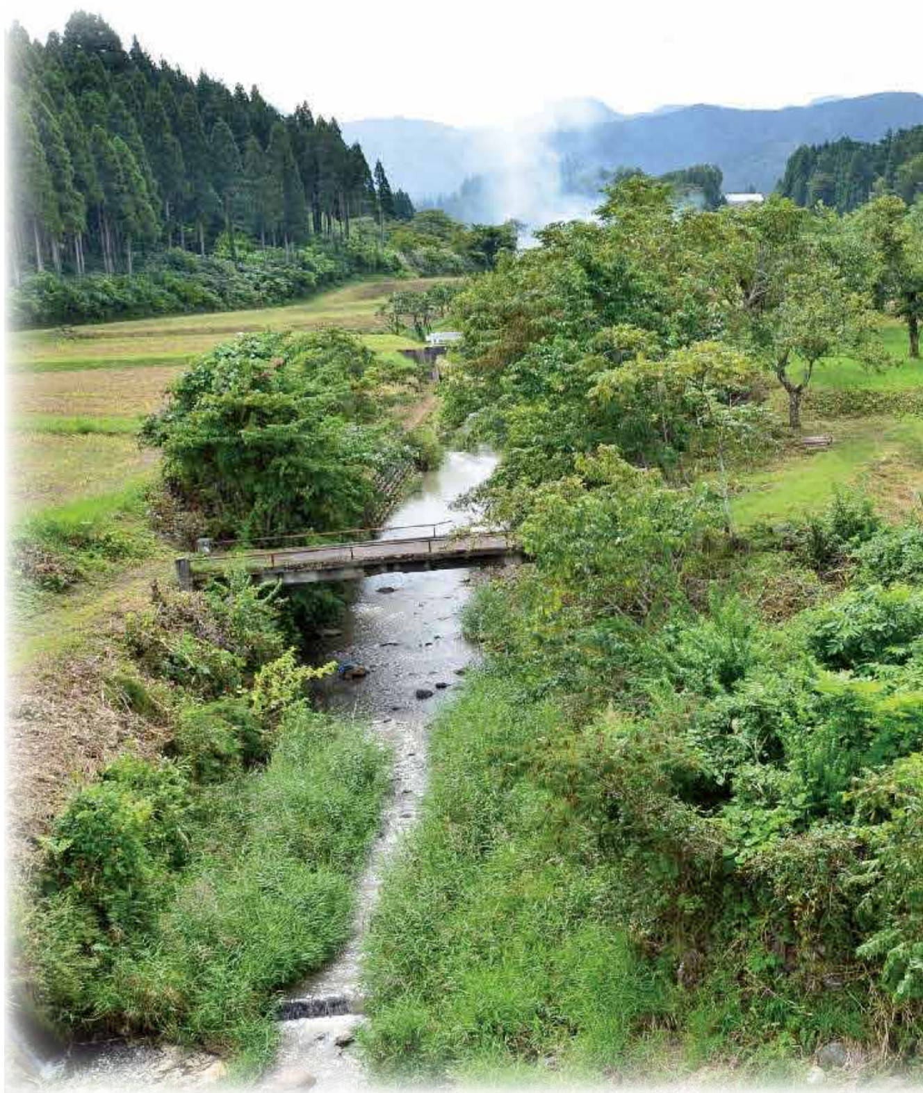
富山の小河川流域の生き物 2015