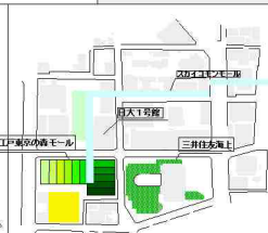
神田山モール計画