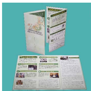
紹介リーフレット